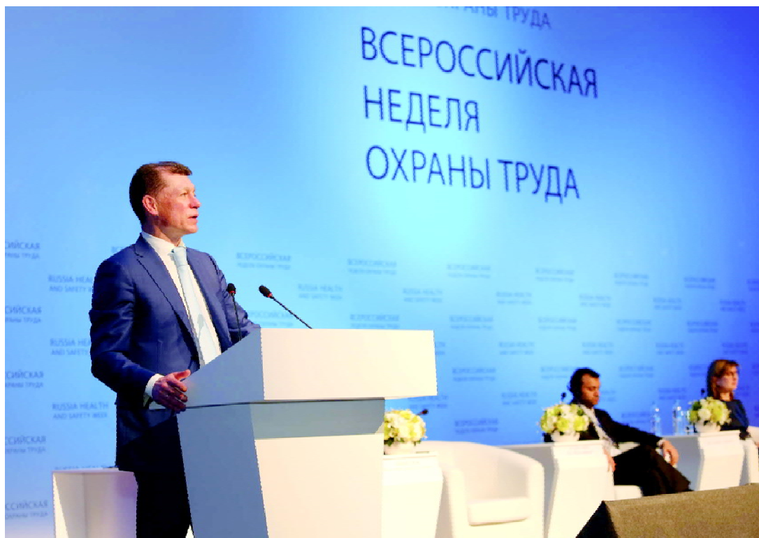
Министр Максим Топилин — на Всероссийской неделе охраны труда: «Самое ценное — это людские жизни и здоровье»

Хочу подчеркнуть, что в нашей компании охране труда и профилактике травматизма на производстве уделяется повышенное внимание. В ТНГ-Групп приказом генерального директора период с 15 апреля по 15 мая объявлен месяцем охраны труда. В его рамках мы провели обучение по охране труда специалистов ЦГИ и аппарата управления, планируются тренировочные занятия, подведены итоги конкурса «За безопасный труд». В ДЗО также проходят мероприятия согласно планам.