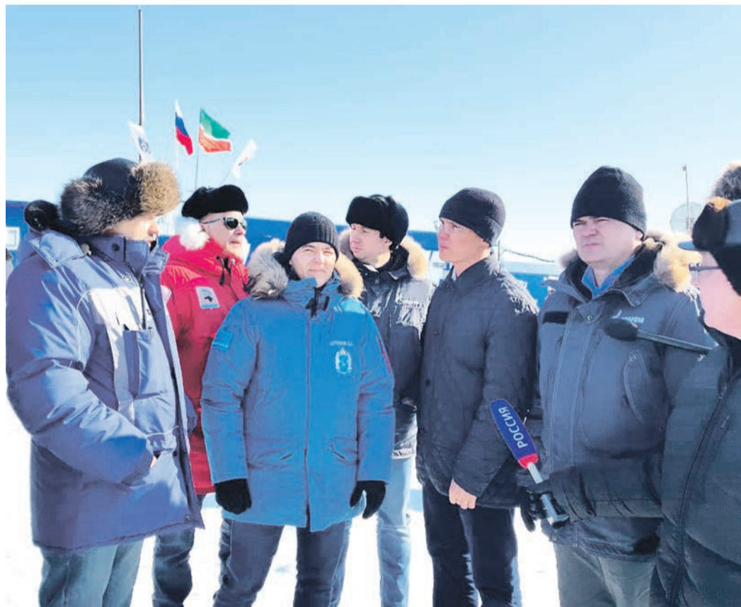
На фото: губернатор ЯНАО Д. Артюхов в с.п. № 22 «ТНГ-Ленское»

Помимо сейморазведки на суше реализация проекта предполагает проведение исследований в транзитной части морской акватории — в Обской губе. Чтобы уникальная «газовая кладовая» полуострова была подготовлена к промышленному освоению уже в ближайшие годы, геофизики готовы выполнить комплекс геологоразведочных работ за три полевых сезона.